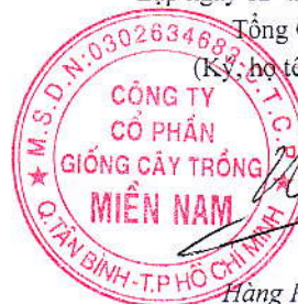
Hàng Phi Quang